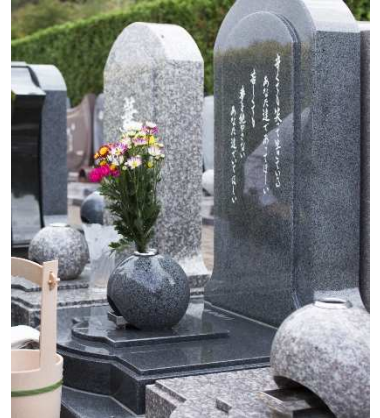
想いを込めてデザインされた墓石 は世界にひとつだけのお墓

子どもたちがインターネットで見つけてくれたことがきっかけです。 「お母さん、上田市内にこんなに素敵な墓地があるわよ」と連絡してきてくれました。実家の近くにこんなに素敵なエンゼルパークさんがあって、管理の負担も少なくて済み、子どもたちにとっても大きな安心材料だったと思います。はじめは、エンゼルパーク内にある2人用の永代供養墓を利用したいと考えておりました。お墓の管理の負担を子どもたちにかかせたくなかったからです。でも、アニバーサリーシステム（永代管理）のことをご説明いただき、私がお墓の管理ができなくなっても、エンゼルパークさんが管理してくださることをお聞きして、家族墓に決めました。