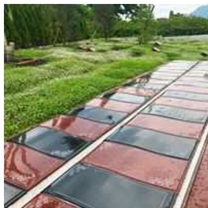
奥 ... エバーグリーン 1人用