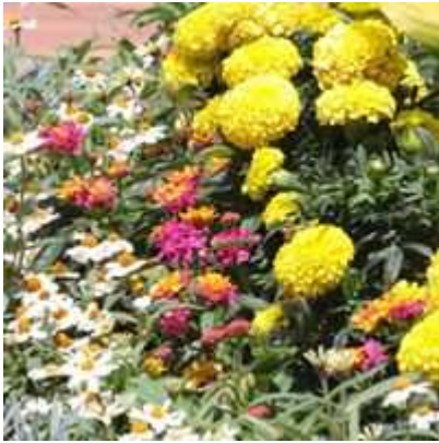
マリーゴールド ジニア フロックス ニチニチソウ eta