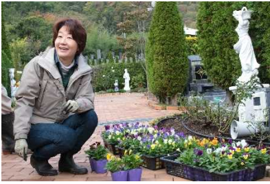
パンジー&ビオラの苗 チューリップ&ヒヤシンス &クロカッスの球根

お花を植えるポイントとして、お花の色合いや丈の高低差、そして開花時期や花の特徴をおさえた上で、配置を決めていきます。