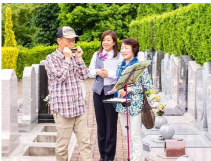
ハーモニカ とても素敵な音色でした!

主人も私もたくさんの趣味があります。私はガーデニング以外に、ハタオリ（佐久の伝統）や藍染めのスカーフをよく作っています。作ることに集中していると、心が癒されるんです。 エンゼルパークに来たときも同じような気持ちになりますよ。素敵なお墓の雰囲気を作り出そうと、内堀さんやガーデナーさんたちがいつも綺麗にお手入れしてくださっています。こんなにたくさんのお花の中で眠れると思うと安心しますね。偶然通りかかったあの時にエンゼルパークに巡り会えて嬉しい限りです。 それから、お花がたくさん咲いているこの雰囲気も素敵だと思います。妻の趣味はガーデニングですから、エンゼルパークの雰囲気によく合いますね。私は趣味でハーモニカを吹いています。ミュージック法要を利用して、納骨の時には私が演奏しようと思っているんです（笑）。