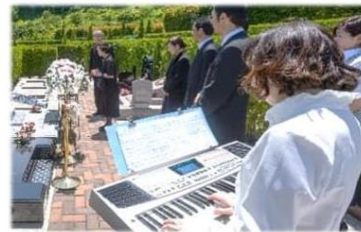
演奏家ソロ(1名)による生演奏・花飾り・生花・仏具

あなたの想いを 音楽にのせて届けます 美しい花飾りや想いでの音楽を 生演奏が奏でる 素敵なセレモニーです ※生花はお持ち帰り可