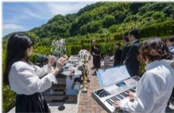
演奏家デュオ(2名)による生演奏・花飾り・生花・仏具

大切なあの人に贈る 最高の供養の形 墓前にはたくさんの花々を飾り 生演奏は二人の演奏家による 感動的な二重奏です ※生花はお持ち帰り可