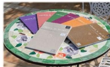
カタログギフトetc. 1,100円(税込)～

感謝の気持ちを お届けする 魅力的な返礼品を 豊富にご用意! ご予算に応じて お選びいただけます