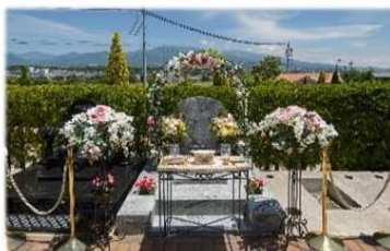
花飾り・生花・香台・仏具

花飾りと生花で お花いっぱい 囲まれた墓前にて 大切なあの人を 温かくお見送ります ※生花はお持ち帰り可