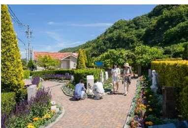
園内に咲き誇る美しい花々

「お墓を建ててよかった！」すべての会員様にそう思っていただけ 理想的な公園墓地を目指しています