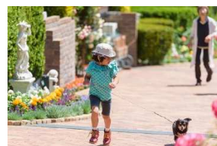
花と緑に囲まれた環境空間