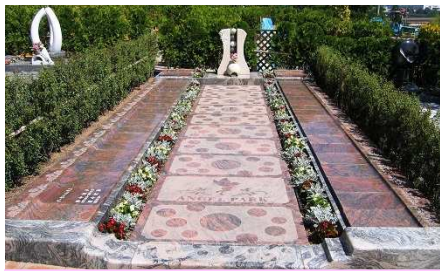
継承者がいなくても安心永代供養墓 えいたいくようぼ