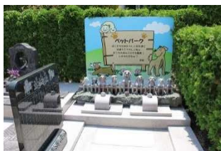
愛するペット供養