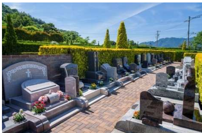
これから代々お守りする家族墓

エンゼルパークの隣りにある渡部園芸さんの小牧山の登山口に立つ石像の高さは2メートル!! 大迫力です。